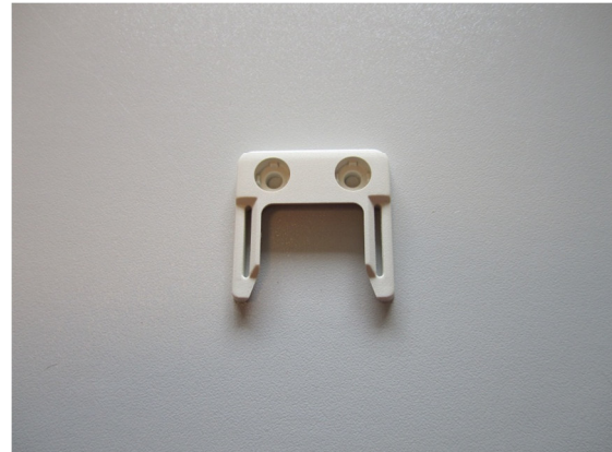
Abbildung 1: Wandhalterung

Die Öffnung des Wandhalters sollte nach unten zeigen, damit der Funkempfänger von unten eingeschoben werden kann. Vergewissern Sie sich, dass der Funkempfänger eingerastet ist und einen fest Halt hat.